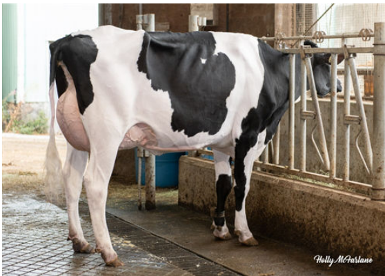
PROGENESIS ZAZZLE PRESTIGE GRANDDAM